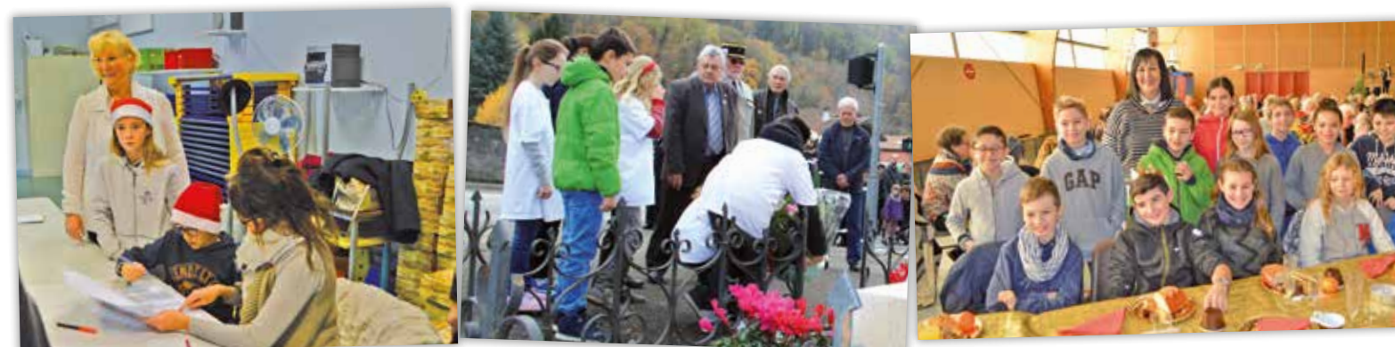
Colis de Noël, commémoration, galette 2018, nos « petits élus » prennent leur rôle très au sérieux !