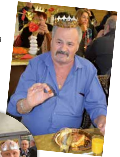
Merci à Toute l'équipe du CCAS