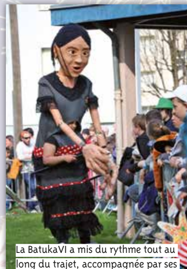
La BatukaVI a mis du rythme tout au long du trajet, accompagnée par ses deux marionnettes géantes qui ont serré beaucoup de mains.

L'après-midi s'est terminée par une boom et une démonstration de hip-hop et de claquettes par Crazy Mouv'