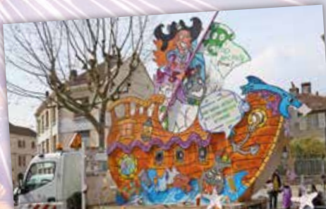
Pour ce Carnaval 2022, la mascotte réalisée par le CMJ avait pris les traits d'une pirate voguant sur les mers, à l'assaut des pollueurs !

Près de 300 personnes se sont réunies pour célébrer le Carnaval, samedi 19 mars, dans les rues de Villard-Bonnot ! Le regard tourné vers l'horizon mais les deux pieds bien sur terre, le Conseil Municipal Jeunes s'est attaqué à un thème au combien actuel : la pollution marine ! Retour sur l'événement qui a souhaité sensibiliser à l'impact des déchets sur la nature ! ●