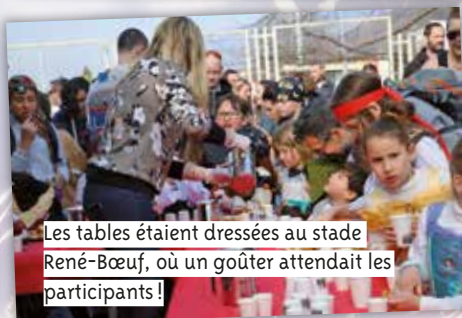
Les tables étaient dressées au stade René-Bœuf, où un goûter attendait les participants !