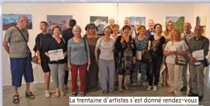
La trentaine d'artistes s'est donné rendez-vous l'année prochaine, pour la 5 e édition du festival !