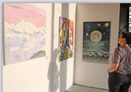
Peintures, sculptures, photographies, il y en avait pour tous les goûts !