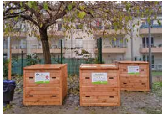
Premier site de compostage de quartier au square Albert-Girard-Blanc, destiné aux habitants des copropriétés voisines, installé en décembre 2023