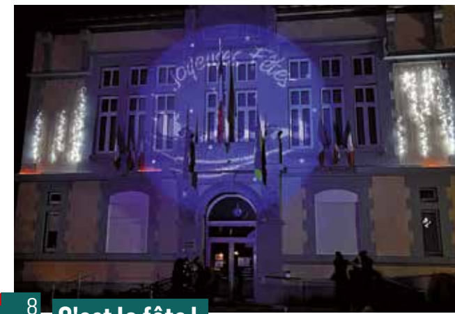
8 décembre - C'est la fête !