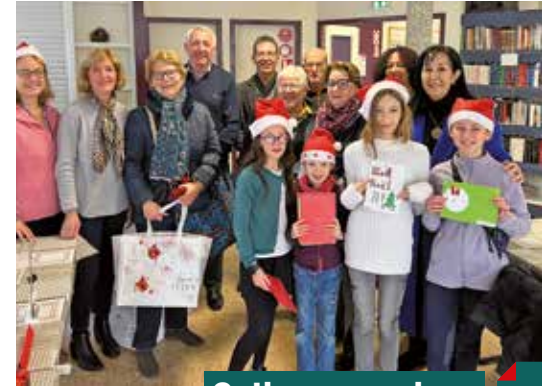
Colis aux seniors 9 décembre

Dimanche 10 : le final d'un week-end festif : le Marché de Noël, sur la place de Brignoud, avec des animations, la venue de Père Noël, les buvettes associatives et les stands bien garnis... Le public a répondu présent ! ●